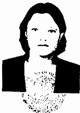
Secretaria de Educación del Estado de Jalisco

Cuya fotografía aparece al margen, cursó y aprobó las asignaturas que se consignan en el plan de estudios de la MAESTRÍA EN CIENCIAS DE LA EDUCACIÓN , con Opción Terminal en PEDAGOGÍA .